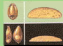
۸- خسارت پوره روی گندم ونان