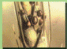
۶- تغذیه پوره سن ۲ و ۳