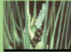
۵- تفریح تخمها ، ظهور پوره ها