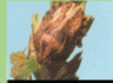
۳- تخم ریزی سن مادر