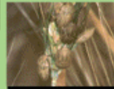
۱۰- تغذیه سن کامل و حرکت به کوه