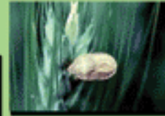
۱- تغذیه سن مادر