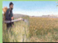
۷- سمپاشی بر علیه پوره سن ۲ و ۳ در مزارع گندم