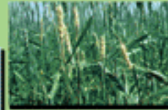
۲- خسارت سن مادربه مزرعه گندم