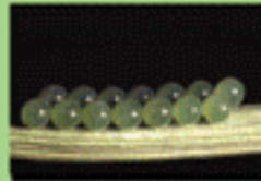
۴- تخم های سن مادر